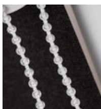
Kedja Transparent Art. nr. 9001