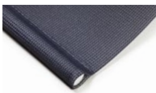
Insydd bottenlist Standardutförande