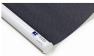
Bottenlist rund, vit Art.nr. R90805