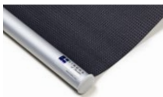
Bottenlist rund, aluminium Art.nr. R9010

För Lindhs Modell 560 kan vissa tillval göras vid beställning, såsom bottenlist i olika varianter eller monterad vev.