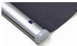
Bottenlist oval, aluminium Art.nr. R90810