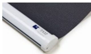
Bottenlist oval, vit Art.nr. R90815