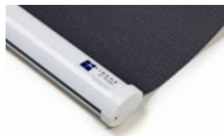
Bottenlist oval, vit Art.nr. R90815