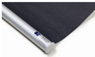
Bottenlist rund, aluminium Art.nr. R9010

För Lindhs Modell 565 kan vissa tillval göras vid beställning, såsom bottenlist i olika varianter.